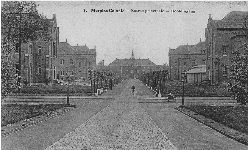
Illustratie 1: Zicht op de hoofdingang van de kolonie van Merksplas, eerste kwart 20ste eeuw, prentbriefkaart uit privé collectie Rik Vercammen.

in grote getale in de Rijksweldadigheidskolonies terechtkwamen? In principe liet de vage formulering in het strafwetboek heel wat interpretatieruimte aan politie en gerecht om te bepalen wie als vagebond geormerkt werd. Zoals we in het artikel aantonen, werd deze interpretatieruimte op zeer verschillende wijzen ingevuld, waarbij mobiliteit lang niet altijd een doorslaggevende rol speelde.