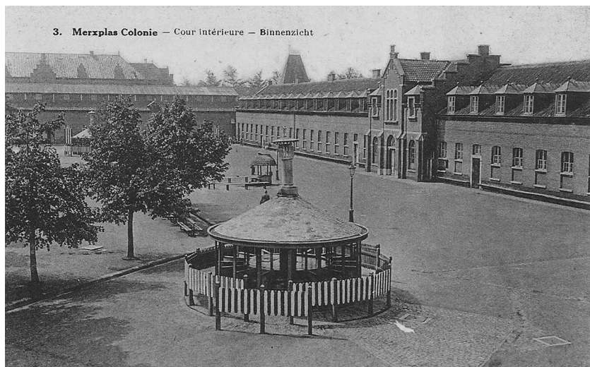
Illustratie 2: Zicht op de binnenplaats van de kolonie van Merxplas, eerste kwart 20ste eeuw, prentbriefkaart uit privé collectie Rik Vercammen.

woonde is niet duidelijk, maar alleszins lang genoeg om daar een onderstandswoonst te hebben verworven. Opvallend is dat hij in totaal tien keer veroordeeld zou worden voor landloperij en bedelarij, en dit zesmaal in Brussel, tweemaal in het nabije Schaarbeek, een keer in het aangrenzende Sint-Joost-ten-Node en een keer in Gent. De ene keer dat hij in Gent werd veroordeeld – zijn geboorteplaats – is eigenlijk het enige moment dat hij ergens buiten de Brusselse regio gelokaliseerd kon worden. Uit de briefwisseling in zijn dossier blijkt dat François C. geregeld in dienst was bij Brusselse werkgevers. Ten minste tweemaal leidde een schrijven van een werkgever aan de directie in Merxplas tot zijn vrijlating. Uit zijn dossier blijkt dat hij in Brussel een bestaan opbouwde, weliswaar onderbroken door een aantal verblijven in de Rijksweldadigheidskolonies.